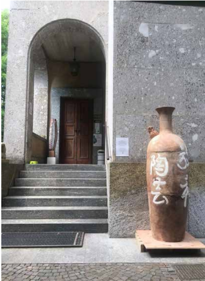
KIZUNA, A. Zilio, argilla semirefrattaria, ossidi e cottura a legna, 2018